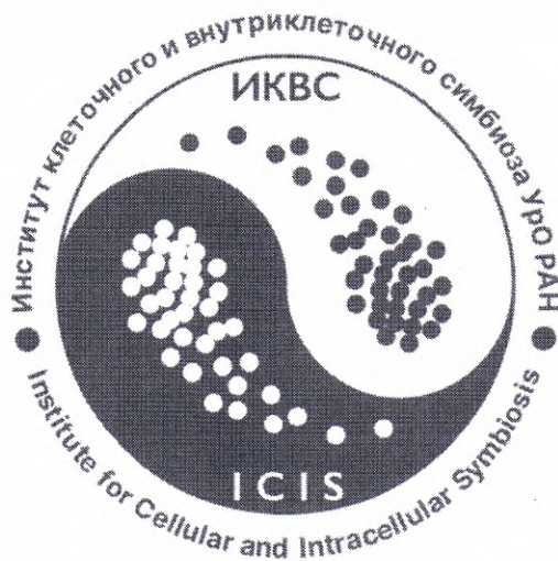
Рисунок эмблемы Института клеточного и внутриклеточного симбиоза Уральского отделения Российской академии наук